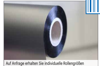
Auf Anfrage erhalten Sie individuelle Rollengrößen