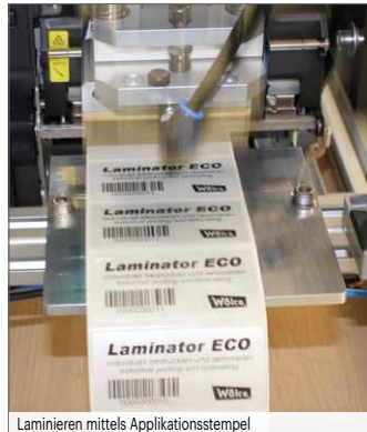
Laminieren mittels Applikationsstempel