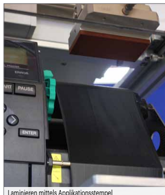
Laminieren mittels Applikationsstempel