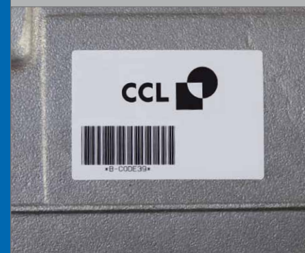
Bedruckte Polyesterfolie - geklebt

Ausgezeichnete Klebkraft auf rauen Untergründen