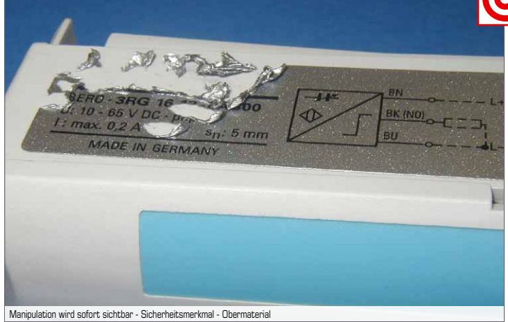
Manipulation wird sofort sichtbar - Sicherheitsmerkmal - Obermaterial