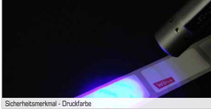
Sicherheitsmerkmal - Druckfarbe

Legen Sie den Betrügern das Handwerk - nur das Original zählt