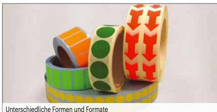
Unterschiedliche Formen und Formate