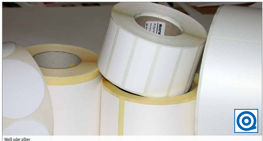
Weiß oder silber