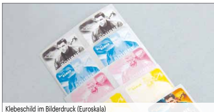
Klebeschild im Bilderdruck (Euroskala)

Mehrfarbige Etiketten – hinterlassen einen bleibenden Eindruck