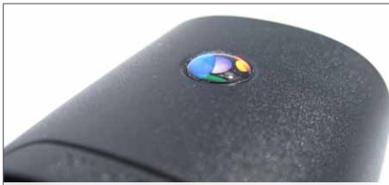
3D-Design Etiketten auf dem Telefon