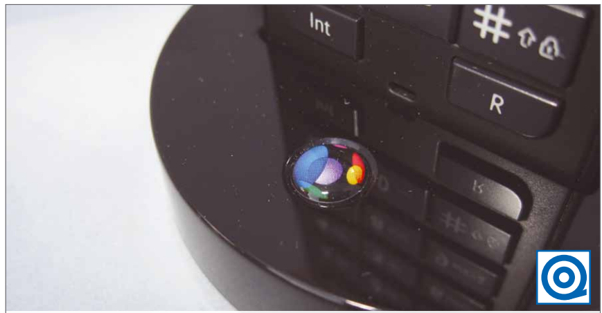
3D-Design-Dome-Etikett auf der Ladestation