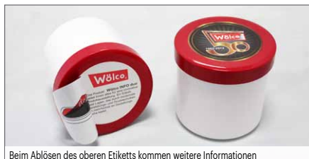
Beim Ablösen des oberen Etiketts kommen weitere Informationen