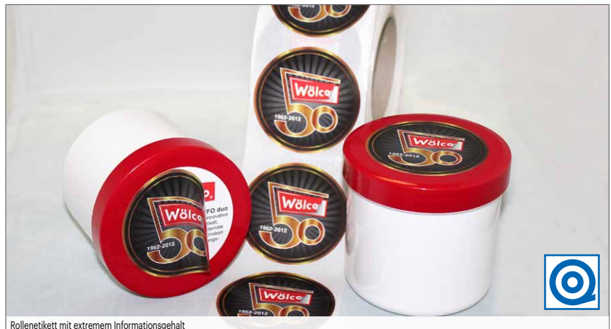
Rollenetikett mit extremem Informationsgehalt