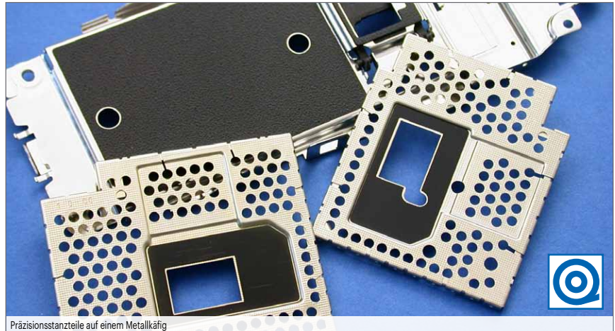
Präzisionsstanzteile auf einem Metallkäfig