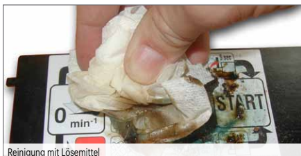
Reinigung mit Lösemittel