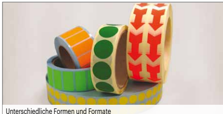
Unterschiedliche Formen und Formate