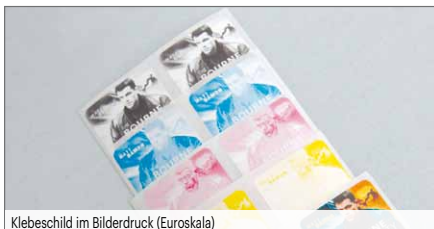
Klebeschild im Bilderdruck (Euroskala)

Mehrfarbige Etiketten – hinterlassen einen bleibenden Eindruck