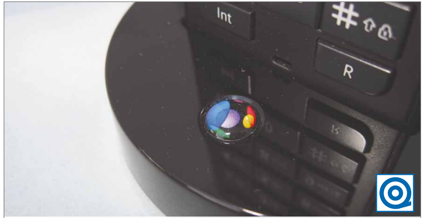
3D-Design-Dome-Etikett auf der Ladestation