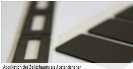
Applikation des Zellschaums als Abstandshalter