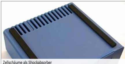
Zellschäume als Shockabsorber